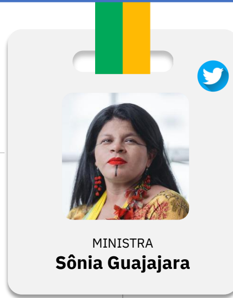
MINISTRA Sônia Guajajara