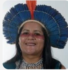
SECRETÁRIO Kerexu Yxapyry