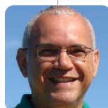
SECRETÁRIO NACIONAL DE PESCA ARTESANAL Cristiano Wellington Norberto Ramalho