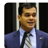
SECRETÁRIO NACIONAL DE PESCA INDUSTRIAL Expedito Netto